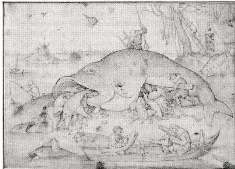
Peștele cel mare îl înghite pe cel mic, Pieter Bruegel cel Bătrân, 1556

„Pe când e omu-n miezul vieții lui M-aflam într-o pădure-ntunecată, Căci dreapta mea cărare mi-o pierdui.