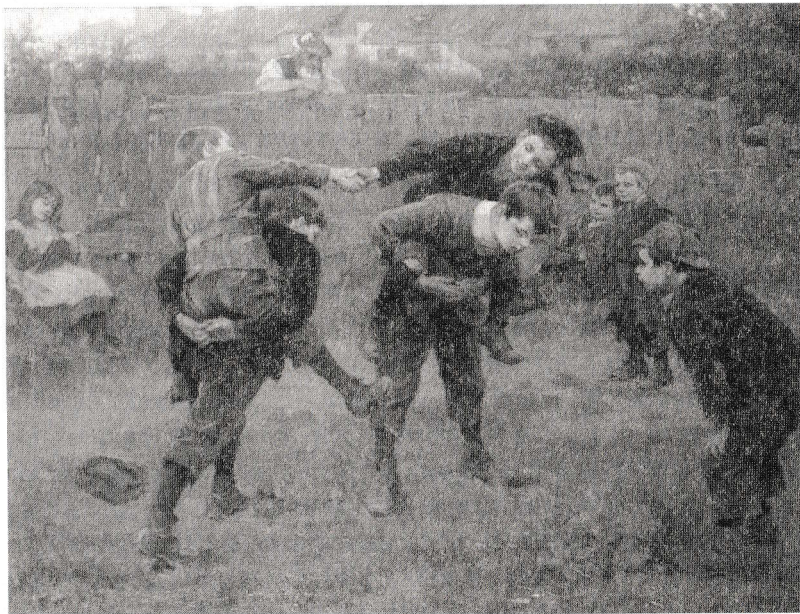
Ralph Hedley, The Tournament, 1898

Nimic nu doare-atât de rău decât de-un timp ferice-a-ți fi aminte în timp de-amar.